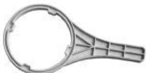
Ключ для крышки фильтра установки 1 шт.