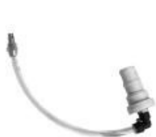
Адаптеры 2 шт.