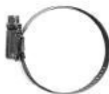
Хомуты 4 шт.