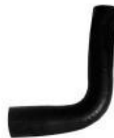
Резиновый соединительный патрубок 1 шт.