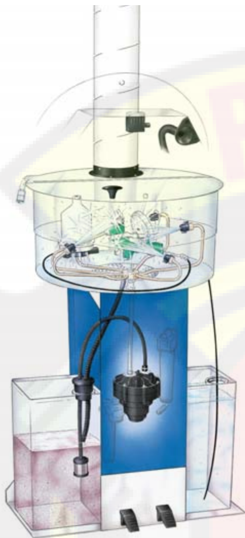
Ножная педаль для ручной промывки