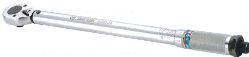
Рисунок 1 - Общий вид ключей модификаций 34323-2A, 34423-1A, 34423-2A

Общий вид ключей представлен на рисунке 1-4.