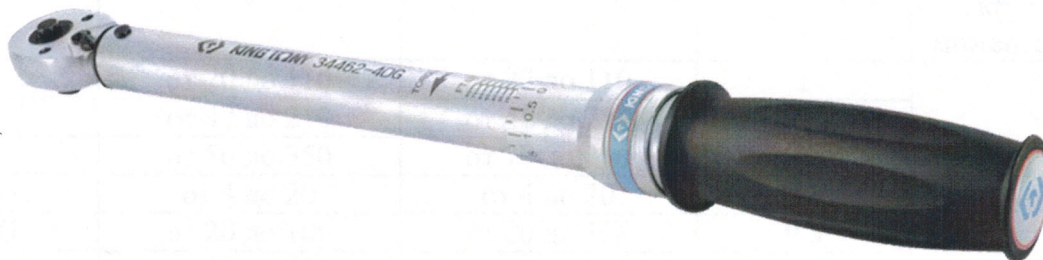
Рисунок 2 - Общий вид ключей модификаций 34262-1DG, 34362-2DG, 34462-1DG, 34462-2DG, 34462-4DG