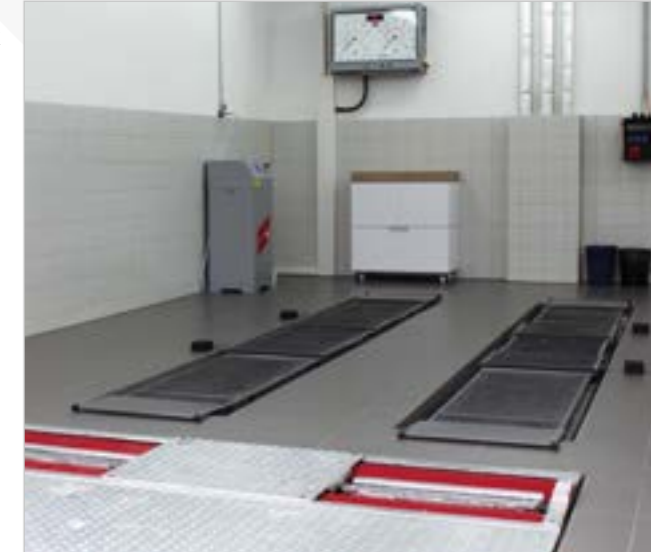
Подключение к ПК (опция)